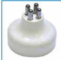
Pièces à main vulvaire

Pièces à main ergonomiques, légères et stérilisables