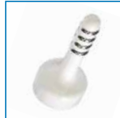
Pièces à main vaginale