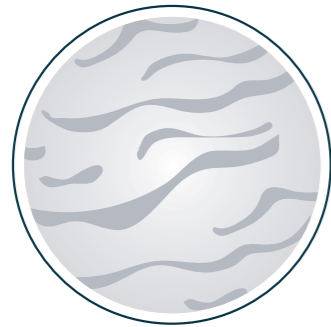
SMAGLIATURE DI TUTTI I TIPI

Il metodo per correggere e nascondere in modo semi permanente e in in due sedute, tutti quegli inestetismi fino ad oggi ritenuti intrattabili: