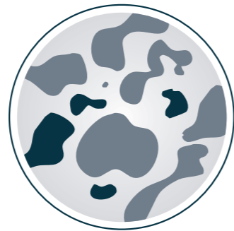
MACCHIE DELLA PELLE (SOLO QUELLE CHIARE)